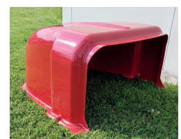
Abdeckung für die Ladestation (optional erhältlich)