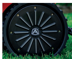
Flex-Gummi-Räder für bessere Traktion und Schonung des Rasens