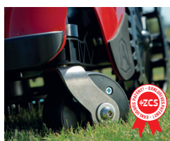
Patentiertes Vorderrad mit Geländeausgleich