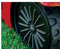
Flex-Gummi-Räder für bessere Traktion und Schonung des Rasens