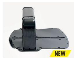
Neus Design der Ladestation